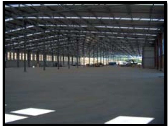
نمایش یوبوت در سقف ساختمان