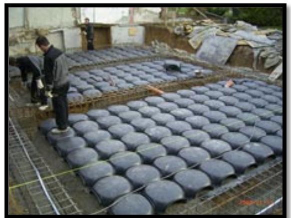
نمایش ایگلو در کف ساختمان