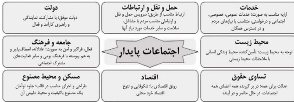
تصویر شماره ۸.۲ مؤلفه اجتماعات پایدار. با اقتباس از Egan Review و پیمان Bristol (دفتر نمایندگی نخست وزیری، ۲۰۰۳؛ Roberts & Jeffrey ۲۰۰۶)